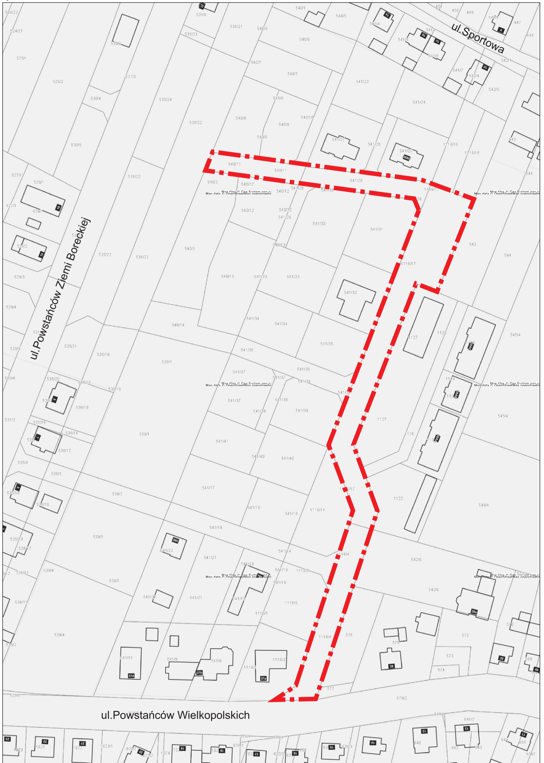
— — — — — Położenie ulicy "Konrada Kulczyńskiego"